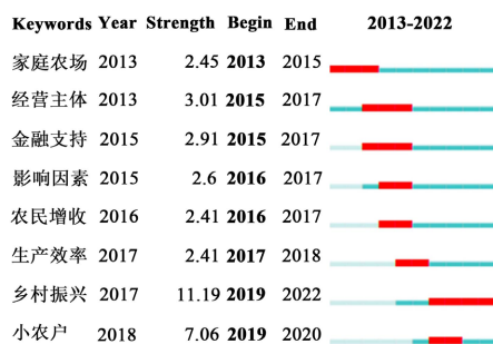
Figure 3. Burst of key words for new agricultural business entities