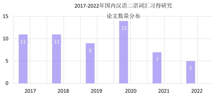
Figure 1. Distribution of the number of research papers on Chinese second language vocabulary acquisition in China from 2017 to 2022 (unit: papers)

我们从《世界汉语教学》《语言教学与研究》《语言文字应用》《汉语学习》《华文教学与研究》和《云南师范大学学报(对外汉语教学与研究版)》等 6 种汉语类专业期刊中共检索出 62 篇(2017~2022 年)汉语二语词汇习得相关论文,论文逐年数量统计如下图 1 所示。